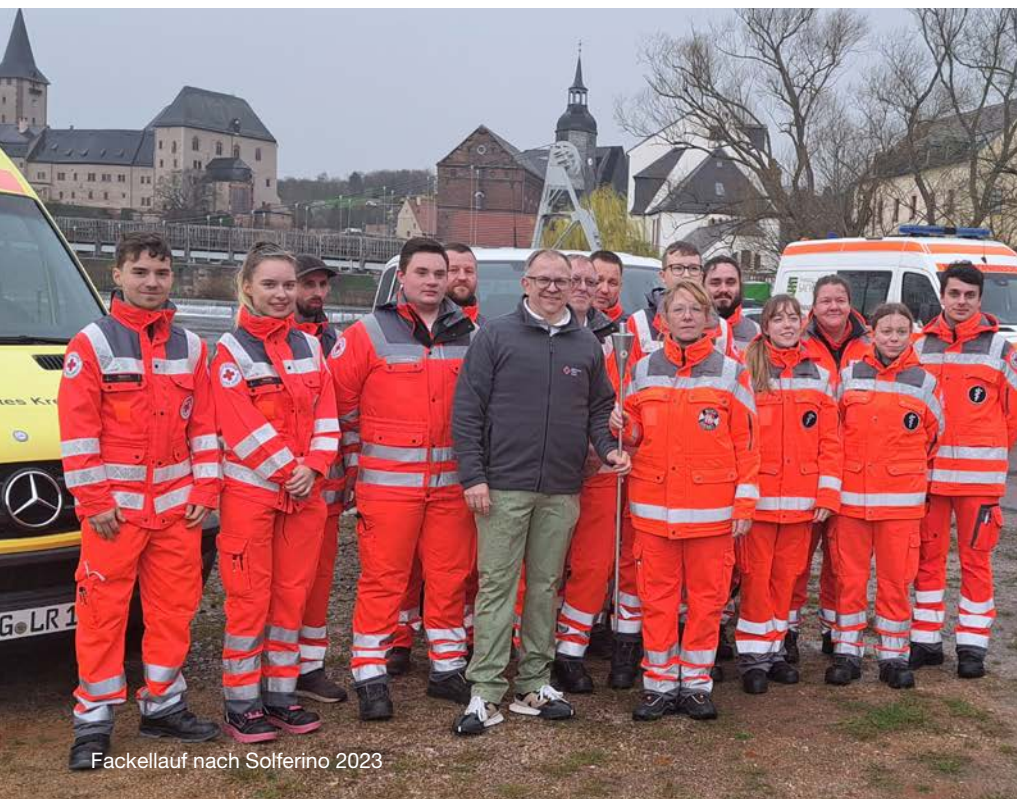
Fackellauf nach Solferino 2023